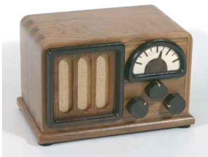
調子の悪いラジオ (1987)