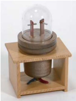
ビックリ大賞 『電球』 半田嵩越