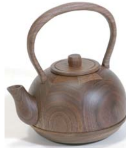
デザイン大賞 『お熱いのが好き?』 宮本要子