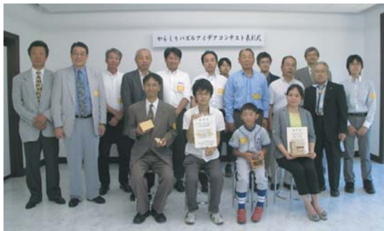
表彰式にて記念撮影

式には箱根町長をはじめとしたご来賓の皆様、受賞者、協力団体の方々など、多くの皆様にご列席いただきました。ありがとうございました。そして、受賞者の皆さんおめでとうございます！