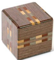
作ったのはこれ 「新秘密箱II」

今年は要望の多かった「大人のための工作教室」も開催しました。 大人の工作教室では、箱根に古くからある、秘密箱の歴史等の話もあり、充実した工作教室となりました。