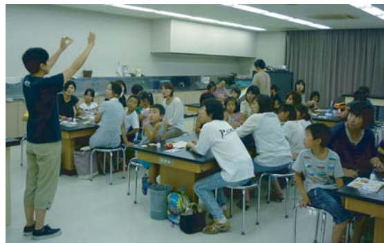
説明を真剣に聞いています。