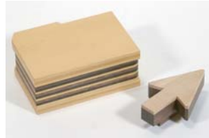
ワクワク大賞 『フォルダ』 増池誠史