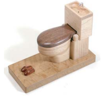
お気に入り大賞 『水に流して!?!』 末田京子