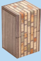
第15回 デザイン大賞 「あみだくじ」