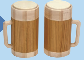
第15回 ワクワク大賞 「乾杯!!」